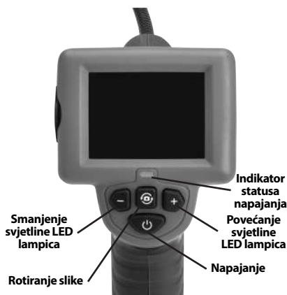
Slika 2 - Komande