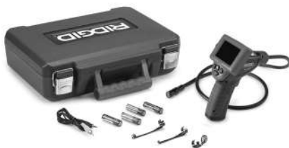
Рис. 1 - Инспекционная видеокамера micro CA-25