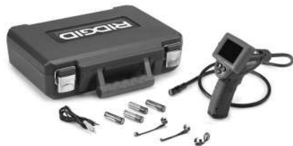
Slika 1 - micro CA-25