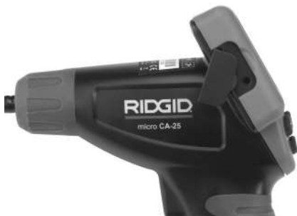
Figura 8 – Enchufe hembra TV-OUT

Introduzca el otro extremo del cable en la entrada hembra Video In en el televisor o monitor. Es posible que el televisor o monitor requieran ser regulados a la posición correcta para mostrar las imágenes siendo transmitidas.