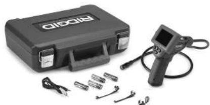
Figur 1 – micro CA-25