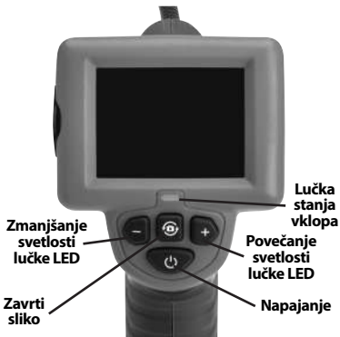
Slika 7 - Krmilni elementi