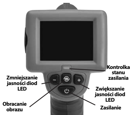
Rysunek 7 – Elementy sterujące

i na obszarze roboczym nie ma osób postronnych i innych przeszkód.