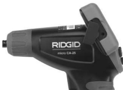
Εικόνα 8 – TV-OUT Jack

Εισαγάγετε το άλλο άκρο στην υποδοχή jack Video In της τηλεόρασης ή του μόνιτορ. Ενδέχεται να χρειαστεί να ρυθμίσετε την τηλεόραση ή το μόνιτορ στο κατάλληλο σήμα εισόδου, ώστε να είναι εφικτή η παρατήρηση.