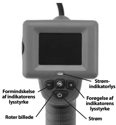
Figur 2 – Kontrolanordninger