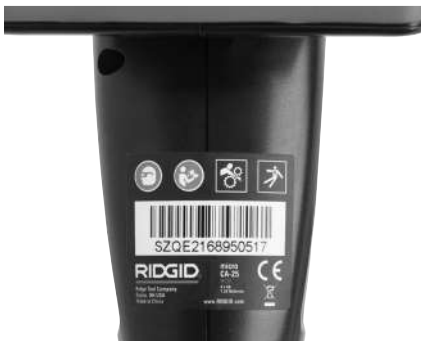
Abbildung 6 – Warnschild