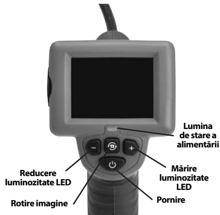
Figura 2 – Comenzi