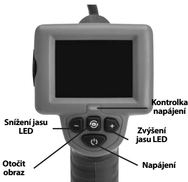
Obrázek 7 – Ovládací prvky