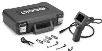
Slika 1 – micro CA-25