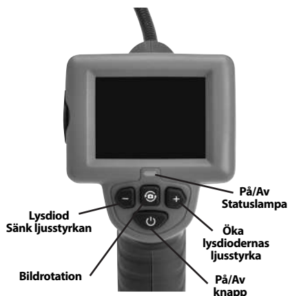
Figur 2 – Reglage