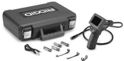
Şekil 1 – micro CA-25