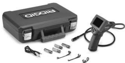
Εικόνα 1 – micro CA-25