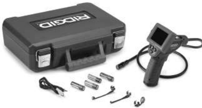
Abbildung 1 - micro CA-25