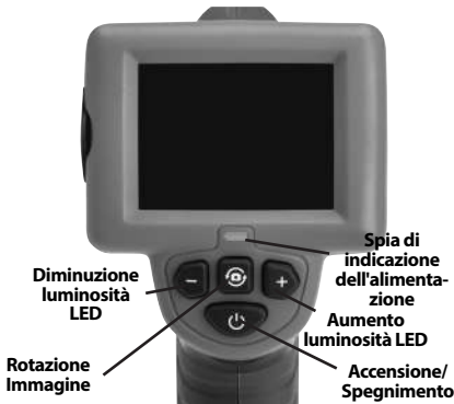
Figura 7 – Comandi