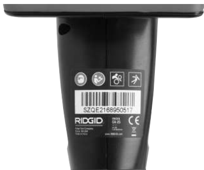
Figuur 6 – Waarschuwingsplaatje