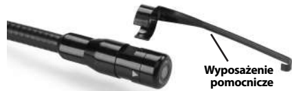
Rysunek 5 – Montowanie akcesoriów

W celu zamontowania należy przytrzymać głowicę kamery, jak pokazano na Rys. 5 Ustawić półokrągłą końcówkę z obejmą nad płaską częścią głowicy kamery jak pokazano na Rys. 5. Następnie obróć o 1/4 obrotu, aż ramię akcesorium zostanie dopasowane we wskazany sposób.