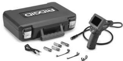
Figur 1 – micro CA-25