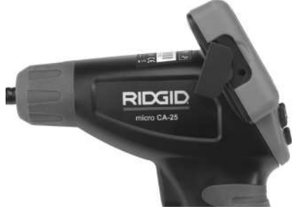
Şekil 8 – TV-ÇIKIŞ Jaki

Diğer ucunu, televizyon veya monitör üzerindeki Video Giriş yakına takın. Televizyon veya monitörün, görüntü alımını sağlamak için doğru girişe ayarlanması gerekebilir.