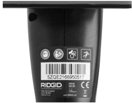
Figure 6 – Warning Label