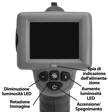
Figura 2 - Comandi