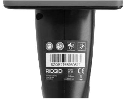
Şekil 6 – Uyarı Etiketi