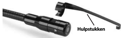
Figuur 5 – Installeren van toebehoren

vervolgens een kwartslag, zodat de lange arm uitsteekt zoals afgebeeld.