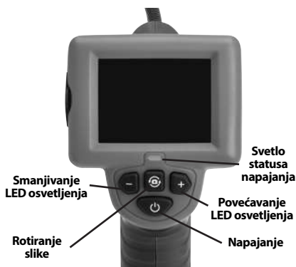
Slika 7 - Upravljački elementi