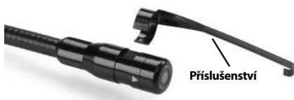
Obrázek 5 – Instalace příslušenství

Při připojování uchopte zobrazovací hlavici způsobem uvedeným na Obrázku 5. Přetáhněte polokruhový konec příslušenství přes plošky na zobrazovací hlavici způsobem uvedeným na Obrázku 5. Potom otočte příslušenství o 1/4 otáčky tak, aby dlouhé raménko příslušenství vyčnívalo ven dle obrázku.