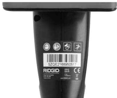
Figur 6 – Varningsdekal