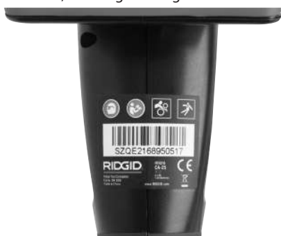
Figura 6 – Rótulo de aviso