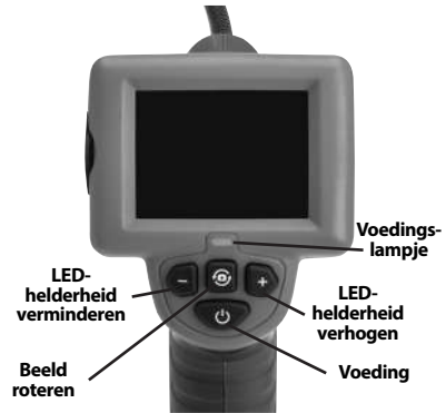
Figuur 7 – Bedieningselementen