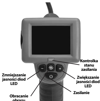
Rysunek 2 - Elementy sterujące