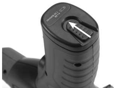
Slika 3 – Poklopac pretinca za baterije