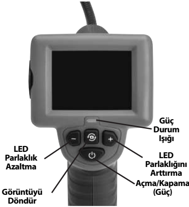
Şekil 2 - Kumandalar