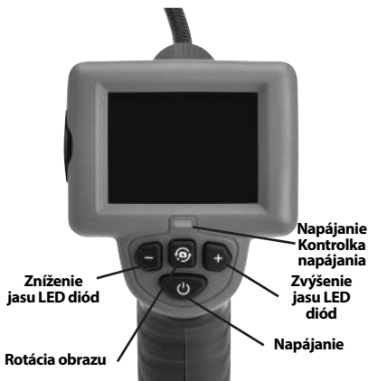
Obrázok č. 2 - Ovládacie prvky