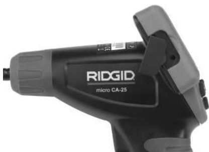
Figuur 8 – TV-out uitgang

Steek het andere uiteinde in de Video In-bus van de televisie of monitor. De televisie of monitor moet mogelijk worden ingesteld op het correcteingangssignaal om een beeld te krijgen.