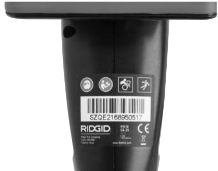
Kuva 6 - Varoitustarra