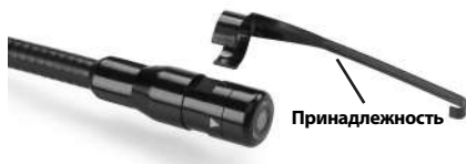
Рис. 5 - Установка аксессуаров

Чтобы прикрепить приспособление, необходимо удерживать головку формирования изображения так, как показано на рис. 5. Вставьте полукруглый конец приспособления на лыску головки формирования изображения, как показано на рис. 5. Затем поверните приспособление на 1/4 оборота так, чтобы его длинная ручка выдвигалась наружу, как показано на рисунке.