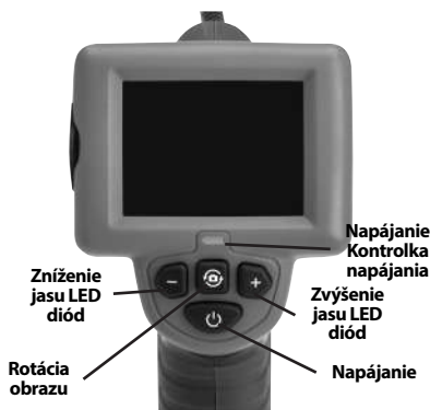
Obrázok č. 7 - Ovládacie prvky