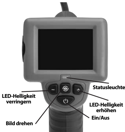
Abbildung 2 – Bedienelemente der Display-Einheit