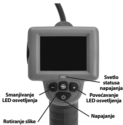
Slika 2 - Upravljački elementi