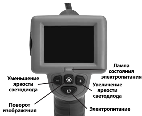
Рис. 7 - Средства управления