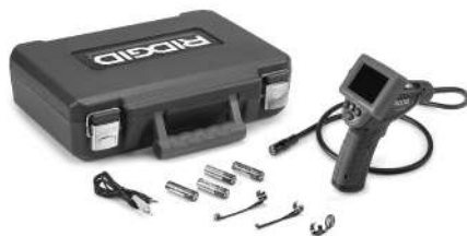
Figura 1 – micro CA-25