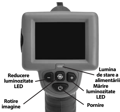
Figura 7 – Butoane de control