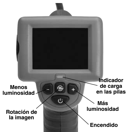
Figura 2 – Mandos