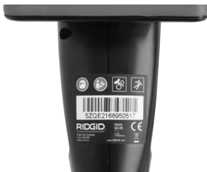
Figura 6 – Etichetta di avvertimento