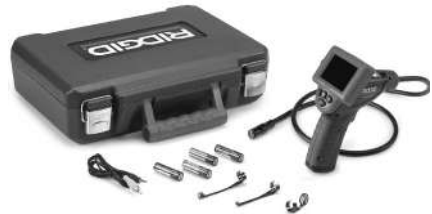
Figure 1 – micro CA-25