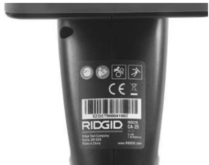
Figur 6 – Advarselmærkat