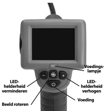
Figuur 2 – Bedieningselementen