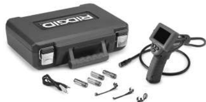
Slika 1 – Kamera micro CA-25