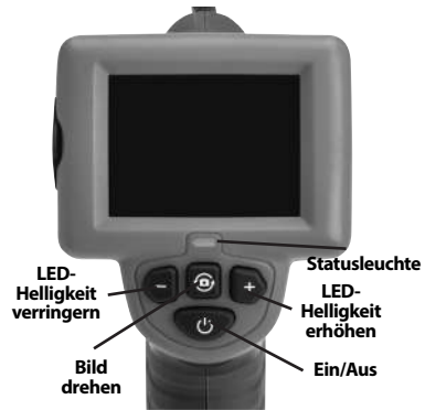
Abbildung 7 – Bedienelemente