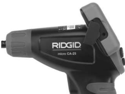
Figure 8 – TV-OUT Jack

Insert the other end into the Video In jack on the television or monitor. The television or monitor may need to be set to the proper input to allow viewing.