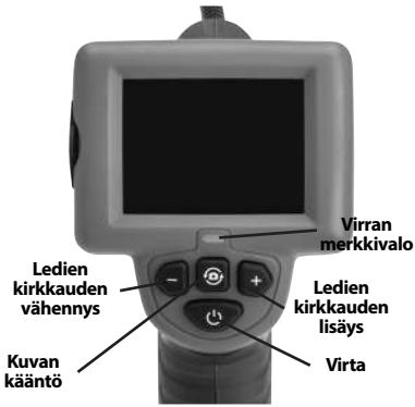
Kuva 7 - Säätimet