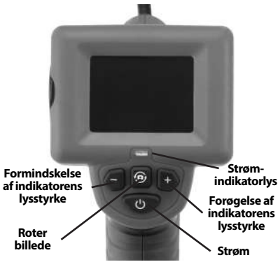
Figur 7 – Kontroltaster