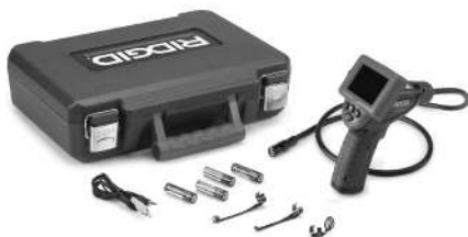
Figure 1 – Caméra d'inspection micro CA-25