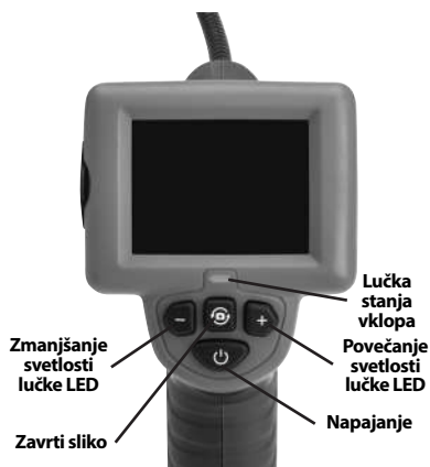
Slika 2 – Elementi za upravljanje