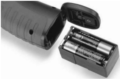
Figura 4 – Caja y compartimiento de las pilas