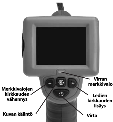
Kuva 2 – Säätimet