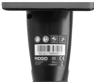
Obrázek 6 – Výstražný štítek