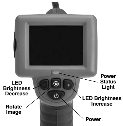
Figure 2 – Controls