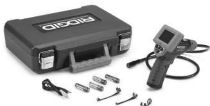
Figur 1 – micro CA-25