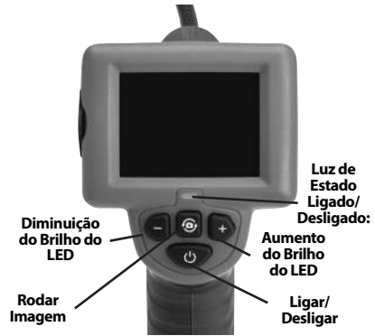
Figura 7 – Controlos