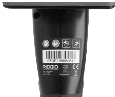
Slika 6 - Upozoravajuća nalepnica