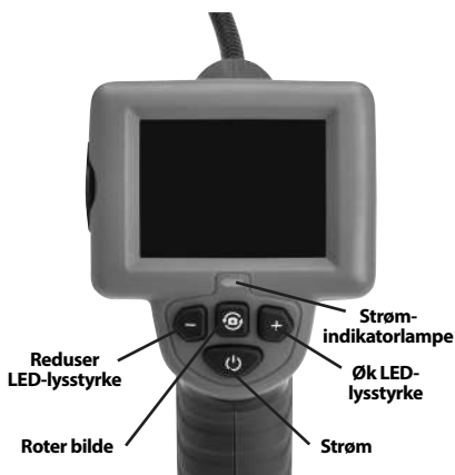
Figur 2 – Kontroller