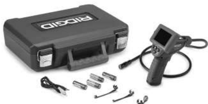
Obrázok č. 1 - micro CA-25