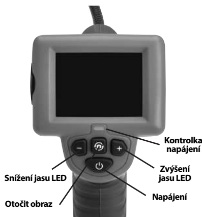
Obrázek 2 – Ovládací prvky