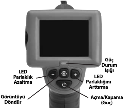
Şekil 7 – Kumandalar