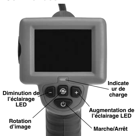
Figure 2 – Commandes