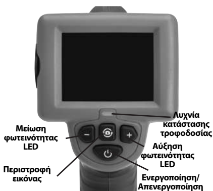
Εικόνα 7 – Χειριστήρια