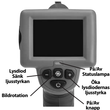
Figur 7 – Reglage