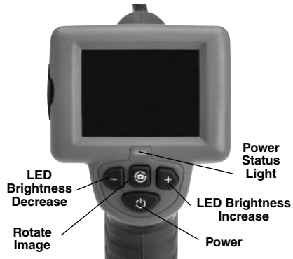
Figure 7 – Controls