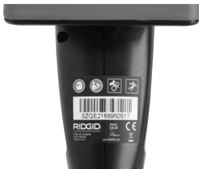
6. ábra - Figyelmeztető címke