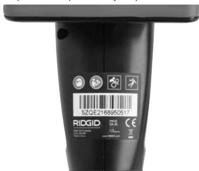
Figura 6 – Etichetă de avertizare