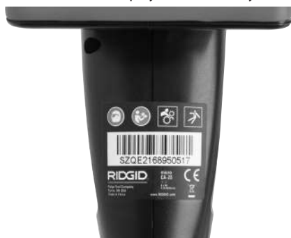
Ryunek 6 – Etykieta ostrzegawcza