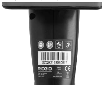
Εικόνα 6 – Ετικέτα προειδοποίησης