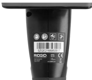
Рис. 6 - Предупредительная этикетка