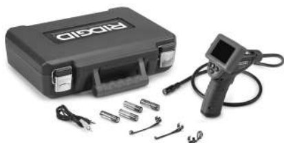
Rysunek 1 - micro CA-25