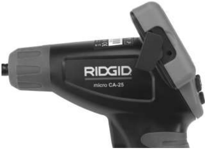
Рис. 8 – Разъем TV-OUT

Вставьте другой конец кабеля в гнездо видеовхода телевизора или видеомонитора. Возможно, для просмотра изображения на телевизоре или видеомониторе придется включить соответствующий вход видеосигнала.