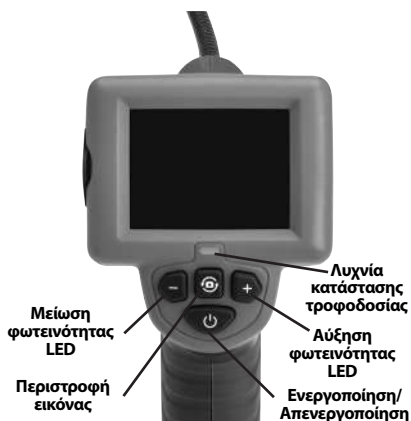
Εικόνα 2 – Κουμπιά ελέγχου