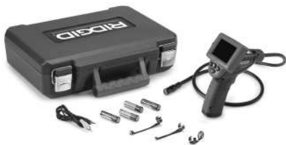
1. ábra - micro CA-25