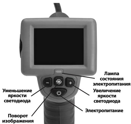
Рис. 2 - Средства управления