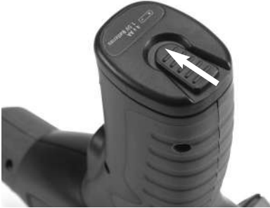
Figura 3 – Tapa del compartimiento de las pilas

CA-25 (ver Figura 4). Retire las pilas usadas de su caja, si es necesario reemplazarlas.