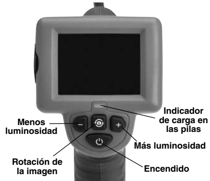
Figura 7 – Mandos