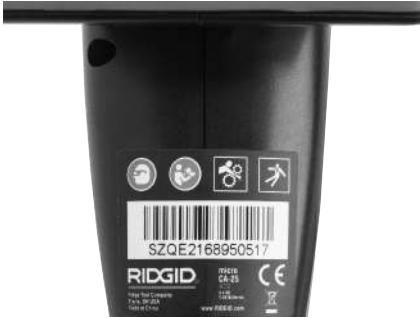
Figura 6 – Etiqueta de advertencias