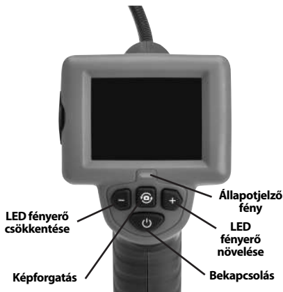
2. ábra – Vezérlők