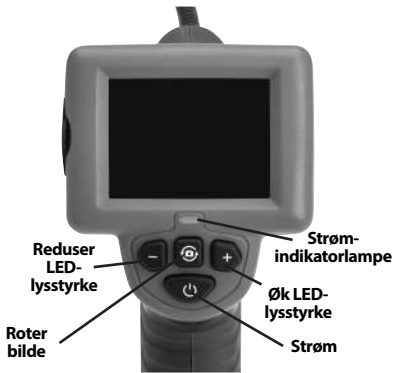
Figur 7 – Kontroller