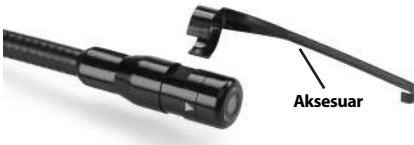
Şekil 5 – Aksesuarların Yerleştirilmesi

Bağlamak için, kamera kafasını Şekil 5 üzerinde gösterildiği gibi tutun. Aksesuarın yarım daire ucunu, Şekil 5'te gösterilen şekilde kamera kafasının içerisine kaydırın. Daha sonra aksesuarın uzun kolu gösterildiği gibi uzanacağı şekilde aksesuarı 1/4 tur döndürün.