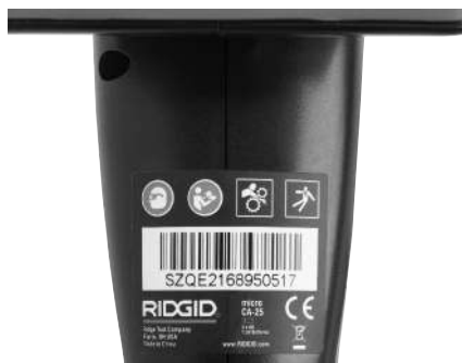
Figure 6 – Etiquette de sécurité