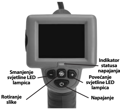
Slika 7 – Komande