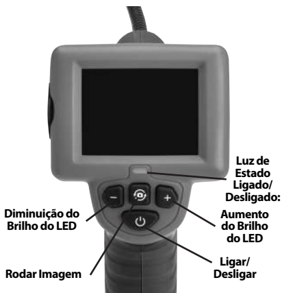
Figura 2 - Controlos